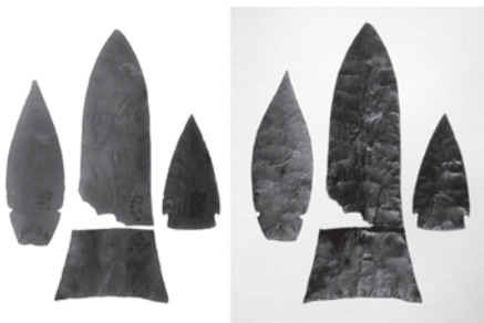
FIGURA 7. Comparación de los artefactos del AMNH (30.0/1951, 30.0/1946A, 30.0/1945B, 30.0/1964) con la fotografía de Le Plongeon (1886: 159, lám. LXIII)