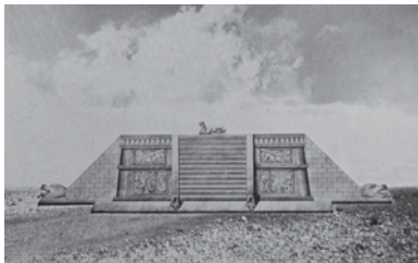
FIGURA 6. Plataforma de las Águilas y Jaguares de Chichén Itzá según Le Plongeon (1896: 155, lám. LVII)