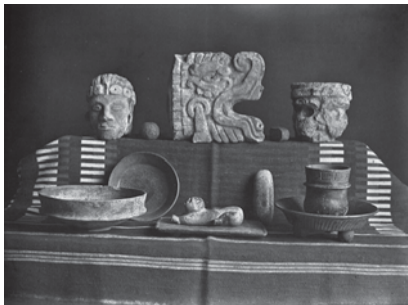
FIGURA 11. Colección de Ernesto Regil.