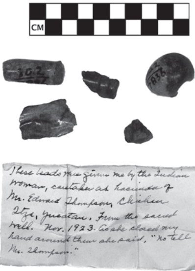
FIGURA 13. Cuentas de jade procedentes del Cenote Sagrado de Chichén Itzá