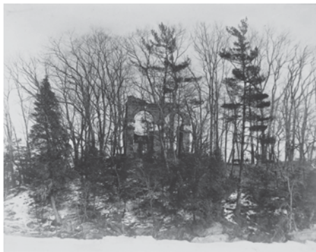
FIGURA 2. Estructura neogótica construida en la Isla Cruger, Nueva York, ca. 1919