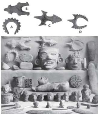
FIGURA 10. Colección de Teobert Maler y excéntricos procedentes de Ticul en el AMNH, A) 30.0/3020; B) 30.0/3023; C) 30.0/3021; D) 30.0/3018.