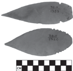
FIGURA 5. Puntas de sílex, AMNH 30.0/1959 y 30.0/1960