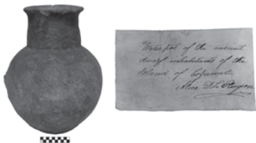
FIGURA 9. Cántaro de barro procedente de Cozumel (1/1988A) y nota manuscrita de Alice Le Plongeon hallada en su interior