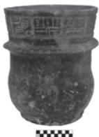
FIGURA 12. Vasija AMNH 30/1515.