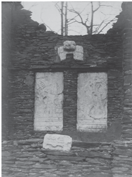
FIGURA 3. Piezas arqueológicas empotradas en la construcción de la Isla Cruger ca. 1919