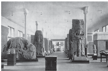
FIGURA 1. Sala de las Estelas, Museo Americano de Historia Natural, Nueva York, ca. 1900