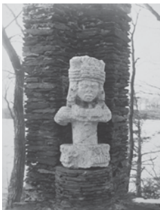
FIGURA 4. Escultura antropomorfa procedente de Uxmal, AMNH 30.0/4779