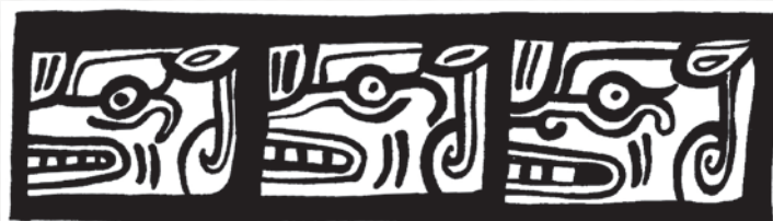
Repeticones de cabezas de murciélago en vasijas estilo Chamá, de las Tierras Altas de Guatemala. Dibujo por A.Cajas

1967 "Historia Natural del Reino de Guatemala". Editorial José Pineda Ibarra, Primera Edición, Guatemala.