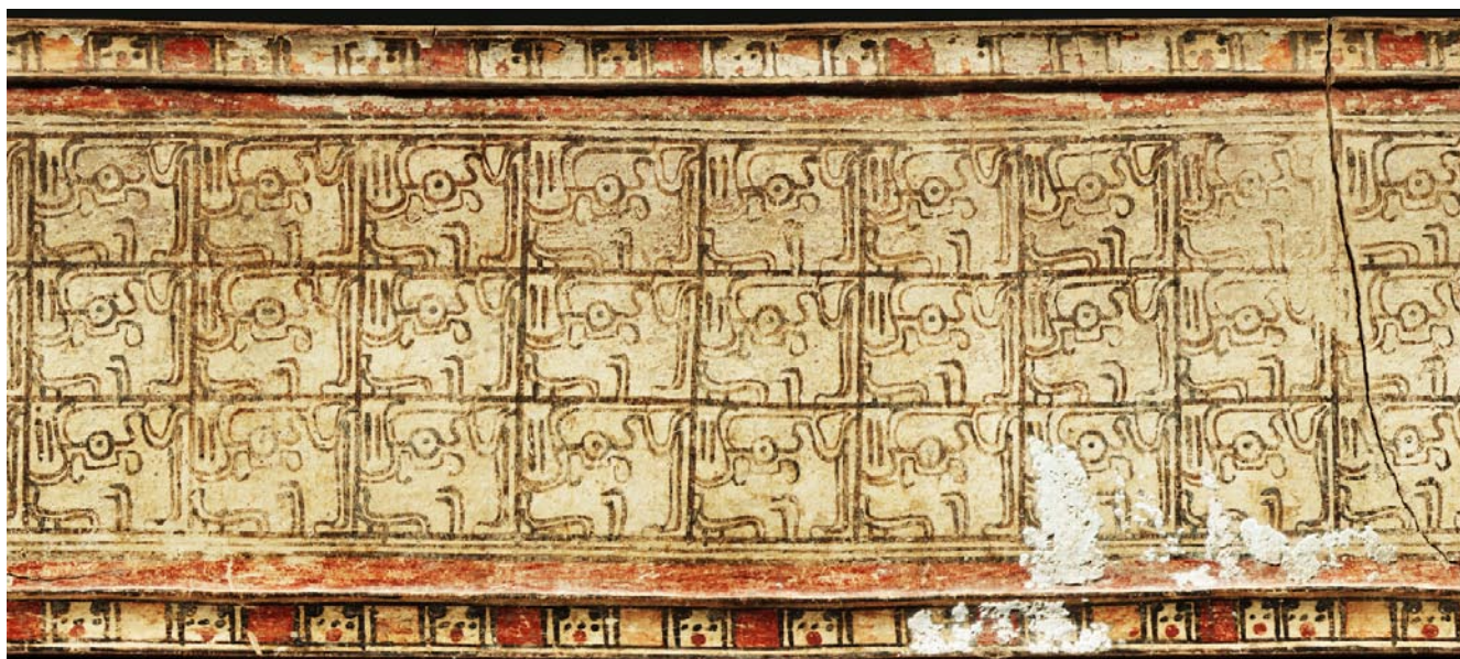
Vasija con series de cabezas de murciélago, del período Clásico Tardío estilo Chamá, de las Tierras Altas de Guatemala.

En la colección del Museo Popol Vuh y el Museo de Copan, existen esculturas similares que representan a un murciélago con las alas extendidas. La escultura mide aproximadamente 60 cms de alto. No se encontró en contexto arqueológico, pero sus características son bastante similares a las de Copan. La imagen se presenta de pie con una banda de glifos sobre la cabeza, tiene una hoja nasal, las alas extendidas, un pectoral y una banda sobre la cintura.