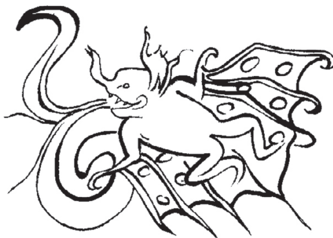
Murciélago del inframundo maya, representado en una vasija estilo Códice, en “The Maya Book Of The Dead”, foto de Vasija 53 por F. Robicsek y M. Hales. Dibujado por A. Cajas.

Estaban pues, allí dentro, pero durmieron dentro de sus cerbatanas. Y no fueron mordidos por los que estaban en la casa. Sin embargo, uno de ellos tuvo que rendirse a causa de otro Camazotz que vino del cielo y por el cual tuvo que hacer su aparición.