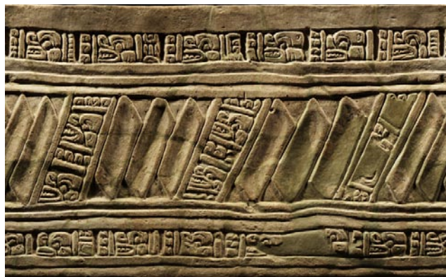
Vasija con repeticiones de cabezas de murciélagos.

Gracias a las detalladas esculturas y modelados que se elaboraron de los murciélagos durante la época prehispánica, y a las investigaciones biológicas y de distribución que se han realizado sobre éste mamífero, ha sido posible monitorear algunas especies, familias y su distribución en Mesoamérica desde la época prehispánica.