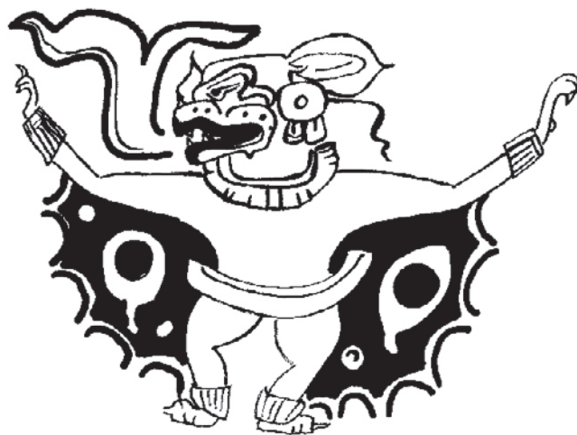
El Camazotz aparece representado en varias ocasiones en la cerámica prehispánica de estilo Chama característico de las Tierras Altas de Guatemala. Figura 6.2 en [Painting the Maya Universe Royal Ceramics of the Classic Period" de D. Reents-Budet. Dibujo por A. Cajas

El estilo Chamá se caracteriza por presentar un fondo amarillo o naranja, con bandas rojas en la parte superior e inferior, con una variedad de escenas de dioses, animales, y seres humanos. También presentan inscripciones jeroglíficas que podrían representar una variante local del sistema de escritura maya (Elin; N.D.). El Camazotz aparece identificado en varias vasijas policromas del estilo Chamá, mostrando sus afilados colmillos con volutas rojas saliendo de su boca, y en ocasiones se ve expuesto el órgano reproductor, en donde claramente se puede observar que las especies corresponden a individuos machos.