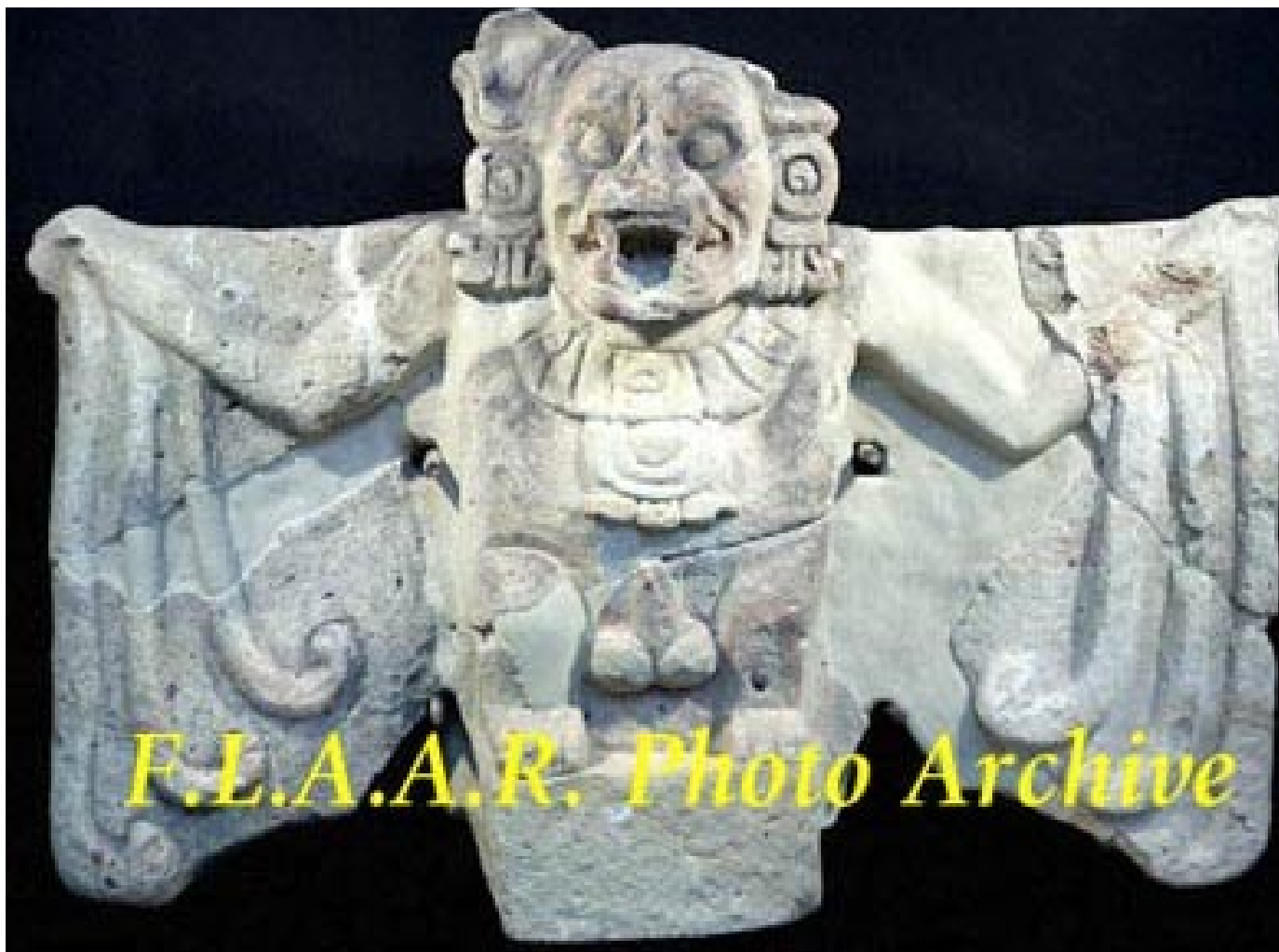
Escultura de murciélago del Museo de Copan Museum, Honduras.

En este sitio se realizaron varias representaciones escultóricas de murciélagos. En la Estructura 20, que actualmente esta completamente destruida por factores naturales, se registraron varias esculturas dedicadas al murciélago que formaban parte de la decoración en la fachada del edificio. Las primeras descripciones y registros fotográficos sobre el edificio y sus magnificas esculturas, fueron hechas en 1930 por el Peabody Museum and Carnegie Institution, en donde describieron una larga serie de esculturas del “murciélago asesino” que en su estado original adornaban el exterior de la Estructura 20 (Fash B. and W. Fash, 1989).