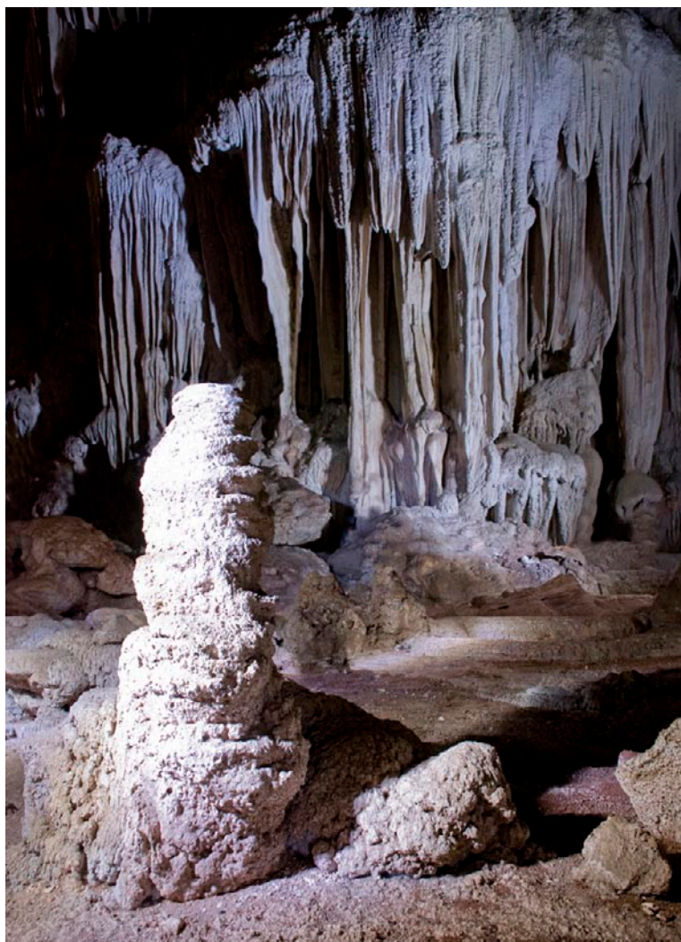
En el Popol Vuh, las cuevas son la casa del Camazots o murciélago que decapita.

De las casi mil especies de murciélagos descubiertas hasta el momento, únicamente tres de ellas son hematófagas ( Desmodus rotundus , Diphylla eucaudata y Diaemous youngii ) y pertenecen a la familia Phyllostomidae. La mayoría de especies en esta familia se alimentan de frutos, polen, néctar e insectos. Esta familia cuenta además con otras 160 especies que habitan únicamente los trópicos del continente americano y otras en los subtrópicos. De estas 160 especies en Guatemala se encuentran alrededor de 60 (Cajas J. N.D.).